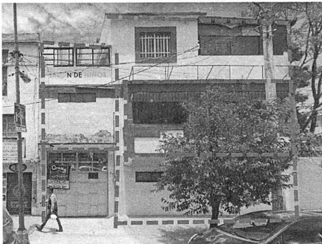
GOOGLE MAPS AGOSTO 2019