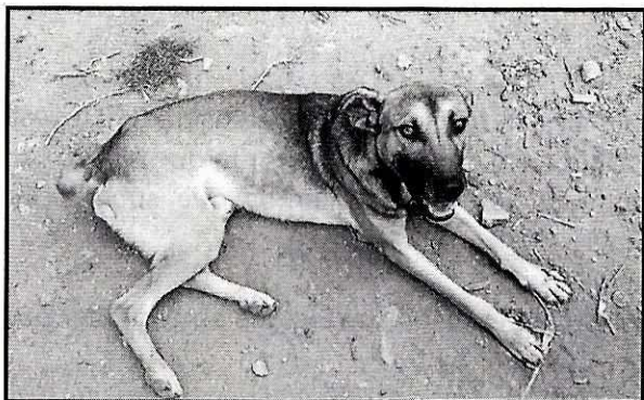
Imagen 1. Ejemplar canino de nombre "Canelón"