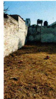
Figura 2. Área verde del inmueble.

En seguimiento, personal de esta Subprocuraduría, trató de comunicarse dos veces con la persona denunciante, con la finalidad de informarle que en sitio señalado en la denuncia, no hay ejemplares caninos; sin embargo no atendió las llamadas, por lo anterior es de concluirse que los hechos que motivaron la denuncia dejaron de existir.