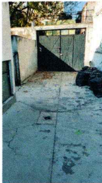
Figura 1. En la imagen se aprecia el patio

Por lo anterior se dejó mediante instructivo oficio, con la finalidad de que el propietario y/o habitante se comunique con personal de esta procuraduría y manifestara lo que a su derecho convenga, dando como resultado que la habitante del inmueble mediante llamada telefónica informara que en dicho sitio no hay ejemplares caninos toda vez que está en remodelación su casa. Enviado evidencia fotográfica, a través de una aplicación de mensajería instantánea para teléfonos inteligentes, en la cual se observó que al interior de dicha casa no hay ejemplares caninos.