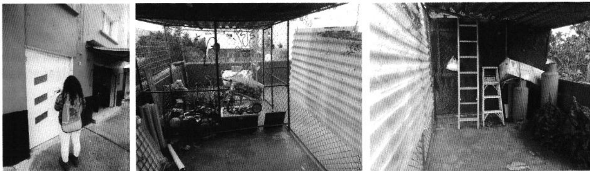
Fotografías 1 a 3. Fachada del inmueble y sitio donde se encontraba el ejemplar canino.

En este sentido, de las constancias que obran en el presente expediente, se desprende que personal de esta Subprocuraduría llevó a cabo una visita de reconocimiento de hechos, de acuerdo a lo establecido en el artículo 15 BIS 4 fracción IV de la Ley Orgánica de esta Entidad, diligencia durante la cual una persona habitante del lugar donde se denunciaron los hechos objeto de la presente investigación, hizo de conocimiento al personal adscrito a esta Subprocuraduría que el ejemplar canino que fue señalado en el escrito de la denuncia, ya no se encuentran en el sitio, lo anterior toda vez que éste falleció debido a cáncer ocasionado por un mastocitoma grado III. Asimismo, el propietario del animal de compañía, remitió de manera electrónica las documentales médico veterinarias con los estudios de laboratorio correspondientes.