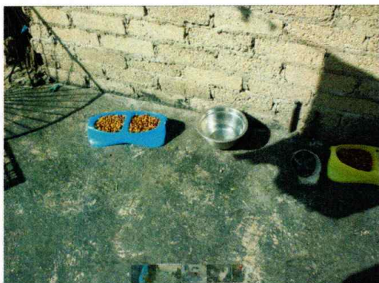
En la imagen se observa el alimento de los caninos.

No. Folio: PAOT-05-300/200- 3 0 4 3 -2022