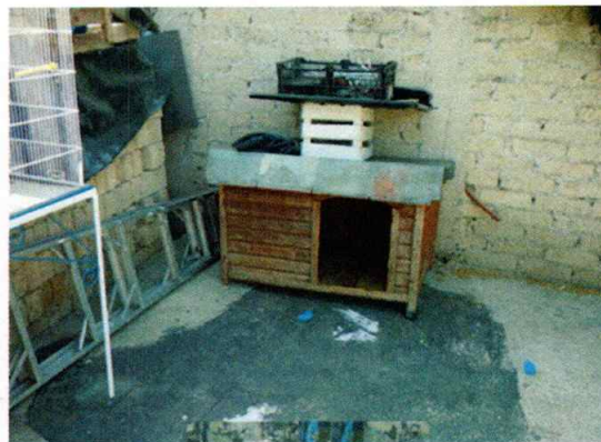
En la imagen se observa la casa de los caninos.

Es de resaltar que, en el Acuerdo de Admisión, que fue enviado por correo electrónico a la persona denunciante, se le hizo de conocimiento que contaba con un término de seis días hábiles para aportar las pruebas que estimara pertinentes en la investigación de los hechos, lo anterior conforme al artículo 90 del Reglamento de la Ley Orgánica de la Procuraduría Ambiental y del Ordenamiento Territorial de la Ciudad de México; sin embargo durante el procedimiento de investigación, no fueron proporcionados elementos de prueba que pudieran determinar incumplimiento a la normatividad en materia de bienestar animal.