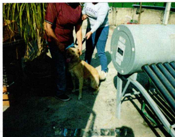
En la imagen se observa al tercer canino.

Medellín 202, piso 4, colonia Roma Sur Alcaldía Cuauhtémoc, C.P. 06000, Ciudad de México Tel. 5265 0780 ext 12011 Y 12400