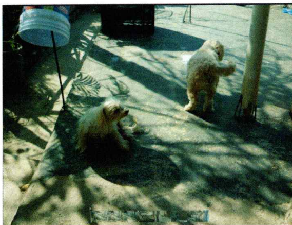
En la imagen se observa a dos caninos.