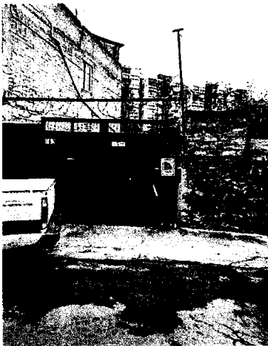
En la imagen se observa el domicilio referido en el escrito de la denuncia.

En este sentido, de las constancias que obran en el presente expediente, se desprende que personal de esta Subprocuraduría llevó a cabo una visita de reconocimiento de hechos, de acuerdo a lo establecido en el artículo 15 BIS 4 fracción IV de la Ley Orgánica de esta Entidad, diligencia durante personal de esta Procuraduría se entrevistó con un habitante del lugar quien refirió que no contaban con ningún perro en su domicilio, por lo que permitió el acceso, constándose que en dicho inmueble no existen ejemplares caninos.