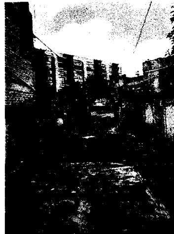
En la imagen se observa que no hay ningún canino en el interior del inmueble.

En virtud de lo antes expuesto, esta Entidad considera procedente emitir la presente resolución, de conformidad con el artículo 27 fracción VI de la Ley Orgánica de esta Procuraduría, por imposibilidad material, en virtud de que dejaron de existir los hechos denunciados, al ya no encontrarse los ejemplares caninos en el lugar de la denuncia.