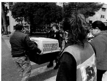
Evidencia de la entrega voluntaria

Derivado de lo observado por personal de esta Entidad, la persona responsable de los ejemplares, entregó de manera voluntaria la ejemplar "Kira" y a sus cachorros al personal de esta Subprocuraduría y se comprometió a darle la atención médica del ejemplar canino "Gordo", a efecto de que le sean brindados los cuidados de bienestar necesarios. Por lo cual la PAOT hizo entrega de los ejemplares a una protectora independiente, quien se comprometió a proporcionar las condiciones adecuadas de bienestar.