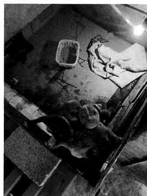
Figura 1. Ejemplares denunciados.

Derivado de lo observado por personal de esta Entidad, la persona responsable de los ejemplares, entregó de manera voluntaria la ejemplar "Kira" y a sus cachorros al personal de esta Subprocuraduría y se comprometió a darle la atención médica del ejemplar canino "Gordo", a efecto de que le sean brindados los cuidados de bienestar necesarios. Por lo cual la PAOT hizo entrega de los ejemplares a una protectora independiente, quien se comprometió a proporcionar las condiciones adecuadas de bienestar.