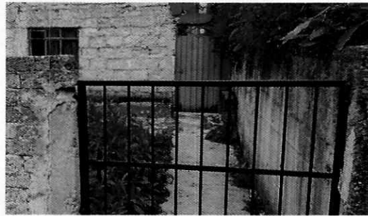
Figura 1. Calle de los hechos denunciados.

En seguimiento de lo anterior, personal de esta Subprocuraduría informó a la persona denunciante que durante visita de reconocimiento de hechos no se constató la presencia de los ejemplares caninos ya que el inmueble no se localizó.