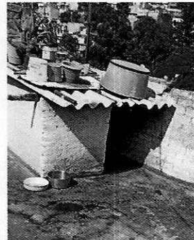
Figura 1 y 2. Ejemplar denunciado y alojamiento