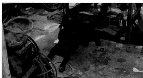
Figura 1-4. Ejemplares denunciados.

Es de resaltar que, en el Acuerdo de Admisión, que fue enviado por correo electrónico a la persona denunciante, se le hizo de conocimiento que contaba con un término de seis días hábiles para aportar las pruebas que estimara pertinentes en la investigación de los hechos, lo anterior conforme al artículo 90 del Reglamento de la Ley Orgánica de la Procuraduría Ambiental y del Ordenamiento Territorial de la Ciudad de México; sin embargo durante el procedimiento de investigación, no fueron proporcionados elementos de prueba que pudieran determinar incumplimiento a la normatividad en materia de bienestar animal.