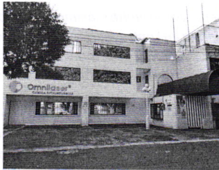
Se muestra el establecimiento motivo de la denuncia.

Dicho lo anterior, se procedió a notificar el citatorio con número de folio PAOT-05-300/200-3542-2021 (...).