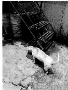
Figura 2. Ejemplares denunciados.

En virtud de lo antes expuesto, esta Entidad considera procedente emitir la presente resolución, de conformidad con el artículo 27 fracción VII de la Ley Orgánica de esta Procuraduría, por el cumplimiento voluntario de las disposiciones jurídicas en materia de bienestar animal