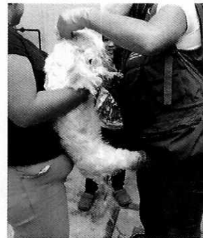
Figura 1. Ejemplares denunciados.

Derivado de lo observado se realizaron las siguientes recomendaciones: