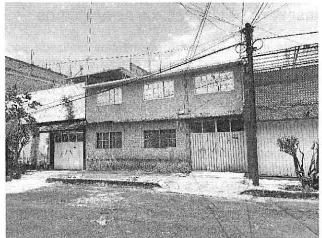
Inmueble denunciado de 2 niveles