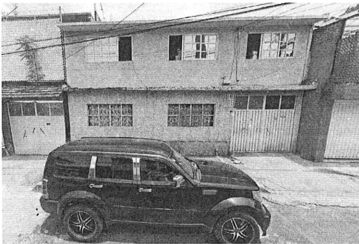
Inmueble denunciado de 2 niveles