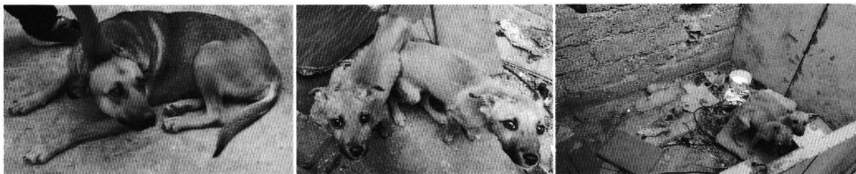
Fotografías 1 a 3. Se muestran ejemplares caninos objeto de denuncia, así como sitio de alojamiento

En ese sentido, la persona encargada del cuidado de los ejemplares caninos presentó evidencia de haber mejorado las condiciones de alojamiento de los cachorros, asimismo, personal de esta Subprocuraduría llevó a cabo una nueva visita de reconocimiento de hechos con la finalidad de dar seguimiento a las recomendaciones antes mencionadas, constatando que los ejemplares caninos cachorros habían sido retirados del sitio.