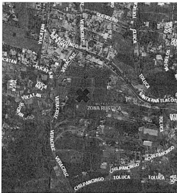
Imagen 3 – Localización del predio objeto de denuncia de acuerdo al inventario de Asentamientos Humanos Irregulares, el predio de mérito no se localiza en ninguno de ellos.