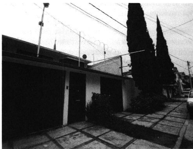
Fotografías 1 y 2. Se muestra fachada del inmueble

En seguimiento de lo anterior, personal de esta Subprocuraduría se comunicó vía telefónica al número proporcionado en el escrito de denuncia, sin embargo, éste era equivocado. Por lo anterior, se envió un correo electrónico a la dirección autorizada para oír y recibir notificaciones a efecto de establecer comunicación con la persona denunciante y solicitar información que permitiera identificar al ejemplar canino objeto de la presente investigación, sin embargo, dicho correo no fue atendido.