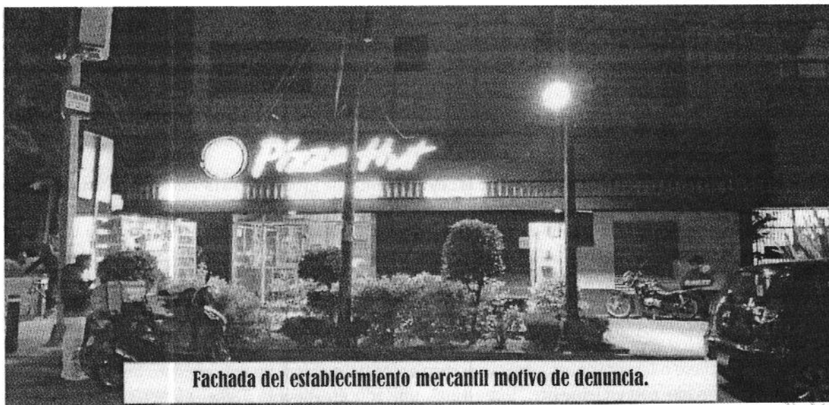
Fachada del establecimiento mercantil motivo de denuncia.

En este sentido, de las constancias que obran en el presente expediente, se desprende que personal de esta Subprocuraduría llevó a cabo un estudio de emisiones sonoras desde el punto de denuncia, durante el cual se constató que el ruido proveniente del sistema de enfriamiento del establecimiento motivo de la presente investigación constituía una fuente emisora, que en las condiciones de operación presentes durante la visita en que se practicó la medición acústica, generaba un nivel sonoro de 65.68 dB(A), el cual excedía el límite máximo permisible de 60 decibeles especificado en la Norma Ambiental NADF-005-AMBT-2013.