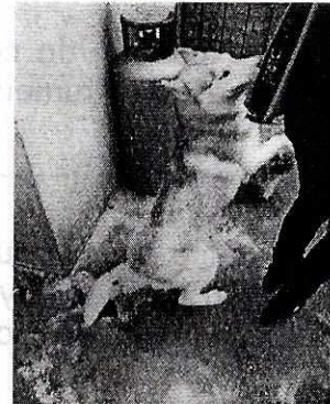
Imágenes de los ejemplares motivo de la presente investigación

Cabe señalar, en el Acuerdo de Admisión, que fue enviado por correo electrónico a la persona denunciante con fecha 16 de julio de 2019, se le hizo de conocimiento que contaba con un término de seis días hábiles para aportar las pruebas que estimara pertinentes en la investigación de los hechos, lo anterior conforme al artículo 90 del Reglamento de la Ley Orgánica de la Procuraduría Ambiental y del Ordenamiento Territorial de la Ciudad de México; sin embargo durante el procedimiento de investigación, no fueron proporcionados elementos de prueba que pudieran determinar incumplimiento a la normatividad en materia de bienestar animal.