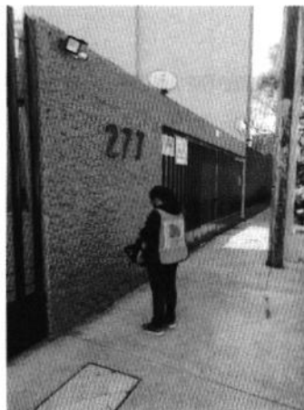
Fotografía 1. Fachada del inmueble objeto de denuncia

En este sentido, de las constancias que obran en el presente expediente, se desprende que personal de esta Subprocuraduría llevó a cabo una visita de reconocimiento de hechos, de acuerdo con lo establecido en el artículo 15 BIS 4 fracción IV de la Ley Orgánica de esta Entidad, diligencia durante la cual no se percibieron emisiones sonoras provenientes de un consultorio dental.