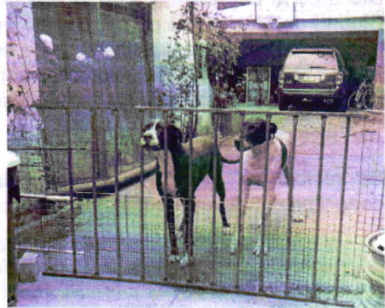
Fotografía 1. Ejemplares caninos motivo de denuncia.

No obstante, esta Subprocuraduría mediante oficio PAOT-05-300/210-1028-2019, hizo del conocimiento del propietario de los ejemplares caninos, las disposiciones vigentes en materia de protección a los animales, conminándolo a su debido cumplimiento. Asimismo, se le exhortó a brindarle la atención médica, mediante el esquema de vacunación de acuerdo a su edad, para reforzar su sistema inmunológico a fin de evitar enfermedades graves y potencialmente mortales, así como la atención médico veterinaria que en su caso pueda requerir.