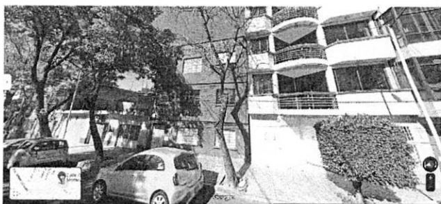
Imagen No. 1 – Se observa un inmueble de 3 niveles.