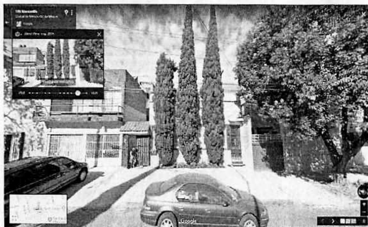
Imágenes 1 y 2. Vista de la vía pública del inmueble ubicado en calle Manzanillo número 189, colonia Roma Sur, Alcaldía de Cuauhtémoc, fechadas en febrero de 2018 (superior) y marzo de 2016 (inferior).

En virtud de lo anteriormente expuesto, y no quedando actuaciones pendientes por parte de esta Subprocuraduría Ambiental, de Protección y Bienestar a los Animales para el caso que nos ocupa, se procede a dar por concluida la investigación de la denuncia ciudadana bajo el número de expediente citado al rubro, con fundamento en el artículo 27 fracción VI de la Ley Orgánica de la Procuraduría Ambiental y del Ordenamiento Territorial.