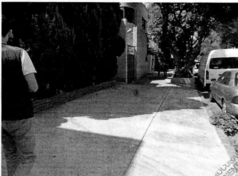
No se constató la colocación de cemento reciente en la banqueta.