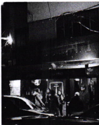
Fotografía 1. Vista del establecimiento mercantil motivo de denuncia.

En este sentido, personal de esta Procuraduría realizó visita de reconocimiento de hechos de acuerdo a lo establecido en el artículo 15 BIS 4 fracción IV de la Ley Orgánica de esta Entidad, durante la cual desde el espacio público, se constató la generación de emisiones sonoras por la reproducción de música grabada.