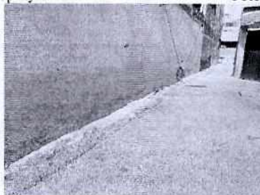
Fotografía 3. Vista del sitio en el cual se localizaban los ejemplares caninos motivo de denuncia.

Por lo tanto, concluyéndose que con las acciones realizadas por la persona propietaria de los animales motivo de la denuncia, se cumple con las condiciones adecuadas de bienestar respecto al alimento, agua, higiene, movilidad, alojamiento y comportamiento. Por lo anterior se da por concluida la investigación de conformidad con el artículo 27 fracción VII de la Ley Orgánica de esta Procuraduría.