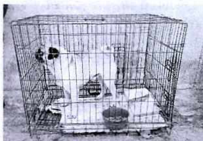
Fotografía 1. Vista del ejemplar canino "Spaky".