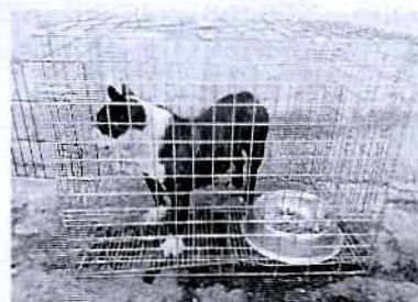
Fotografía 2. Vista del ejemplar canino "Luna".