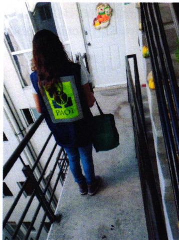
En la imagen se observa el sitio denunciado.

En este sentido, de las constancias que obran en el presente expediente, se desprende que personal de esta Subprocuraduría llevó a cabo una visita de reconocimiento de hechos, de acuerdo a lo establecido en el artículo 15 BIS 4 fracción IV de la Ley Orgánica de esta Entidad, diligencia durante la cual una persona habitante del lugar donde se denunciaron los hechos objeto de la presente investigación, hizo de conocimiento al personal adscrito a esta Subprocuraduría que el ejemplar canino que fue señalado en el escrito de la denuncia, ya no se encuentra en el inmueble, lo anterior toda vez que en días anteriores derivado de un conflicto entre los vecinos el canino fue retirado del lugar y dado en adopción. Cabe señalar que el personal de la PAOT constató que efectivamente no había algún ejemplar con las características descritas en la denuncia al interior del domicilio en cuestión.