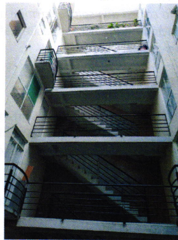
Se constata que el ejemplar ya no se encuentra.

En seguimiento de lo anterior, personal de esta Subprocuraduría informó a la persona denunciante que durante visita de reconocimiento de hechos no se constató la presencia del ejemplar canino en el sitio señalado en su denuncia, por lo que los hechos que motivaron su denuncia dejaron de existir.