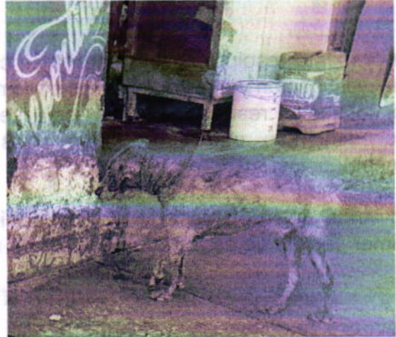
Vista del ejemplar canino con el servicio de estética que se le realizó.

No obstante, mediante oficio PAOT-05-300/220-0446-2019, se hizo del conocimiento del responsable de los ejemplares caninos objeto de investigación, las responsabilidades que se tienen que cumplir al tener animales de compañía, conminándolo a su debido cumplimiento.