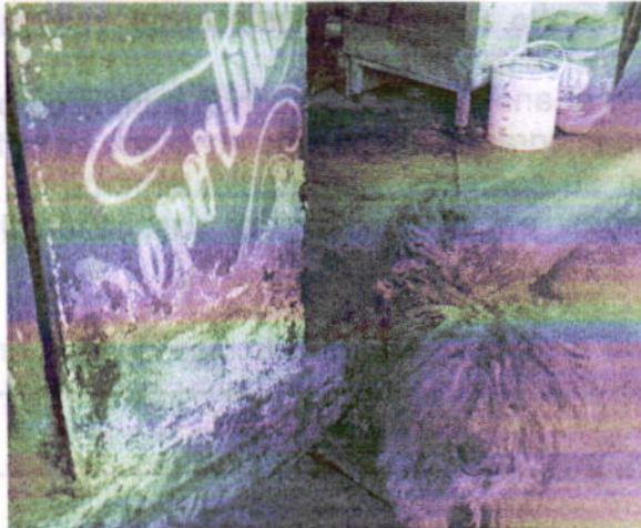
Vista del ejemplar canino con el pelaje largo y sucio.