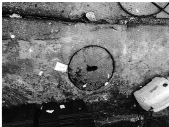
Alcantarilla con residuos de agua color amarillo

Por lo anterior, el 23 de marzo de 2019 se presentó ante esta Subprocuraduría una persona que se ostentó como responsable de los tambos y/o contenedores situados en la vía pública del inmueble ubicado en calle Norte 74-C, número 10025, colonia Del Obrero, Alcaldía Gustavo A. Madero; quien al tomar conocimiento de la denuncia manifestó que sus actividades no tienen relación con el domicilio de mérito y que sólo le permiten ocupar la azotea y la banqueta adyacente; no obstante, ya los retiró del lugar.