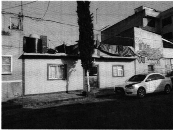
Fachada del inmueble denunciado