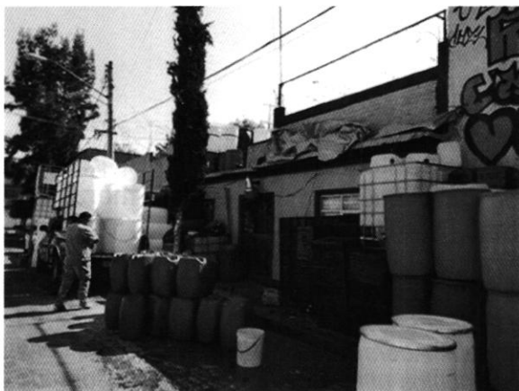
Fachada del inmueble denunciado

Al respecto, el 12 de marzo de 2019 personal adscrito a esta Subprocuraduría realizó un reconocimiento de los hechos al domicilio motivo de denuncia, durante el cual constató que en la banqueta adyacente había contenedores, tambos, garrafones y cubetas que obstruían el paso peatonal; así también, una alcantarilla de agua pluvial con residuos de un líquido color amarillo, sin corroborar olores. En dicho acto se notificó el oficio citatorio PAOT-05-300/220-0528-2019, a efecto de que el propietario y/o representante legal aportara información relacionada con la presente investigación.