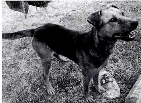
Fotografías 2 y 3. Vista de los ejemplares caninos que responden a los nombres de "Nena" y "Osa".