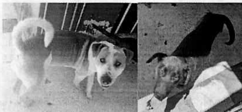
Ejemplares caninos motivo de denuncia

No obstante, esta Subprocuraduría mediante el oficio correspondiente, hizo del conocimiento de la persona habitante del domicilio referido, las disposiciones vigentes en materia de protección a los animales, conminándola a su debido cumplimiento.