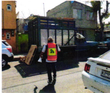
Figura 1. Lugar de los hechos denunciados.

algún ejemplar canino amarrado a un vehículo localizado en el espacio público; al respecto, una persona habitante del predio antes referido, manifestó que no contaba con animales de compañía.