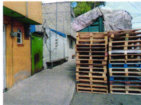
Figuras 2 y 3. Lugar de los hechos denunciados.

En seguimiento de lo anterior, personal de esta Subprocuraduría informó a la persona denunciante que durante visita de reconocimiento de hechos no se constató la presencia del ejemplar canino en el sitio señalado en su denuncia, por lo que los hechos que motivaron su denuncia dejaron de existir.