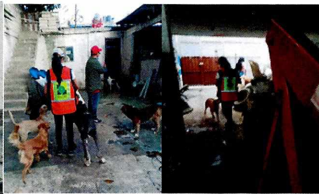
Imagen 2 y 3 Personal en interacción con los caninos motivo de la denuncia dentro del inmueble referido

Medellín 202, piso 4, colonia Roma Norte Alcaldía Cuauhtémoc, C.P. 06000, Ciudad de México Tel. 55 5265 0780 ext 12011 Y 12400