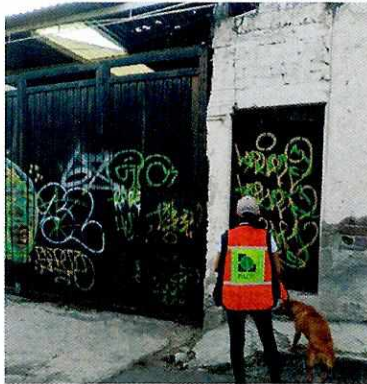
Imagen 1. Fachada del domicilio motivo de la denuncia