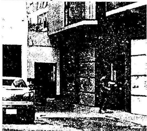
Imagen 3 – Ocupación de la vía pública en las inmediaciones del inmueble investigado.