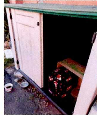
Imagen 3. Lugar de resguardo en el patio así como tazones de alimento y agua

Es de resaltar que, en el Acuerdo de Admisión, que fue enviado por correo electrónico a la persona denunciante, se le hizo de conocimiento que contaba con un término de seis días hábiles para aportar las pruebas que estimara pertinentes en la investigación de los hechos, lo anterior conforme al artículo 90 del Reglamento de la Ley Orgánica de la Procuraduría Ambiental y del Ordenamiento Territorial de la Ciudad de México; sin embargo durante el procedimiento de investigación, no fueron proporcionados elementos de prueba que pudieran determinar incumplimiento a la normatividad en materia de bienestar animal.