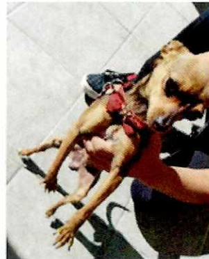
Imagen 2. Carino llamada "Nala" motivo de la denuncia