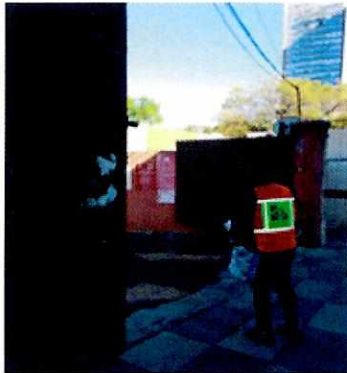
Imagen 1. Fachada del domicilio