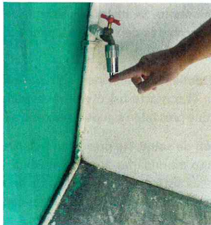
Imagen 2 y 3. Cartillas de vacunación y bebedero automatico.