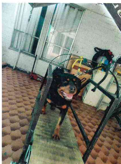
Imagen 4 y 5. Ejemplares motivo de denuncia.