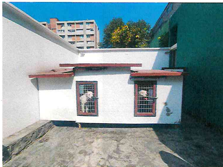
Imagen 1. Lugar de alojamiento

Condición de salud. No presentan lesiones evidentes en los ejemplares caninos; no obstante se le exhortó al propietario a brindarles atención médica, mediante el esquema de vacunación de acuerdo a su edad, para reforzar sus sistemas inmunológicos a fin de evitar enfermedades graves y potencialmente mortales, por lo que durante el presente acto mostró las cartillas de vacunación correspondientes.