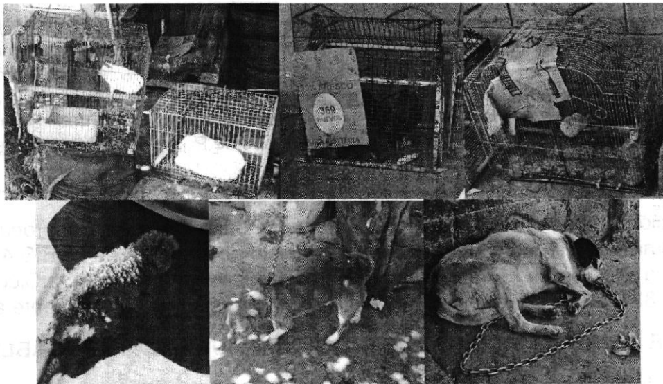
Animales motivo de denuncia.

Por lo anterior, se entregó el citatorio para que se presentaran ante esta Procuraduría en la fecha señalada a la comparecencia, en donde se presentó quien manifestó ser la persona responsable de los ejemplares la cual se comprometió a brindarles agua limpia a libre acceso, ampliar el alojamiento de los animales enjaulados, alargar la cadena de los ejemplares caninos, colocar un techo que proteja de la intemperie y darles atención médica veterinario cuando pudieran requerirla.