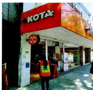
Imagen 1. Fachada del lugar motivo de la denuncia

No obstante lo anterior, mediante oficio PAOT-05-300/200-1491-2021, se hizo de conocimiento del propietario y/o responsable del establecimiento, las obligaciones que tienen las personas responsables de animales, entre ellas de brindar un trato digno y respetuoso a éstos.