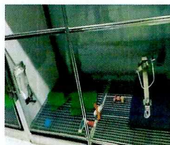
Imagen 3. Jaulas de resguardo nocturno vacías

En virtud de lo antes expuesto, esta Entidad considera procedente emitir la presente resolución, de conformidad con el artículo 27 fracción VI de la Ley Orgánica de esta Procuraduría, por imposibilidad material, en virtud de que dejaron de existir los hechos denunciados, al ya no encontrarse los ejemplares caninos en el lugar de la denuncia.