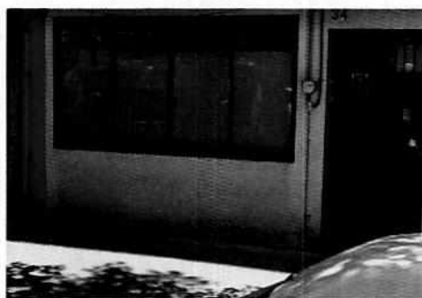
Lugar de los hechos denunciados

En este sentido, de las constancias que obran en el presente expediente, se desprende que personal de esta Subprocuraduría llevó a cabo dos visitas de reconocimiento de hechos, de acuerdo a lo establecido en el artículo 15 BIS 4 fracción IV de la Ley Orgánica de esta Entidad, diligencia durante la cual una persona habitante del lugar donde se denunciaron los hechos objeto de la presente investigación, hizo de conocimiento al personal adscrito a esta Subprocuraduría que el ejemplar canino que fue señalado en el escrito de la denuncia, ya no se encuentra en el inmueble, lo anterior toda vez que fue trasladado a un rancho fuera de la ciudad de México. Cabe señalar que el personal de la PAOT constató que efectivamente no había algún ejemplar con las características descritas en la denuncia fuera del domicilio en cuestión.