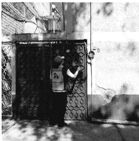
Fotografía 1. Fachada del inmueble señalado como el de los hechos denunciados.

En este sentido, de las constancias que obran en el presente expediente, se desprende que personal de esta Subprocuraduría llevó a cabo una visita de reconocimiento de hechos, de acuerdo a lo establecido en el artículo 15 BIS 4 fracción IV de la Ley Orgánica de esta Entidad, diligencia durante la cual una persona habitante del lugar donde se denunciaron los hechos objeto de la presente investigación, hizo de conocimiento al personal adscrito a esta Subprocuraduría que el ejemplar canino que fue señalado en el escrito de la denuncia, ya no se encuentran en el inmueble, lo anterior toda vez que éste fue dado en adopción. Cabe señalar que el personal de la PAOT constató que efectivamente no había algún ejemplar con las características descritas en la denuncia al interior del domicilio en cuestión.