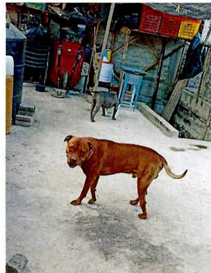
Imagen 2. Ejemplar canino de nombre "Toto"

En virtud de lo antes expuesto, esta Entidad considera procedente emitir la presente resolución, de conformidad con el artículo 27 fracción VI de la Ley Orgánica de esta Procuraduría, por imposibilidad legal, al no constatar irregularidades en materia de bienestar animal.