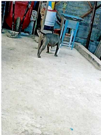
Imagen 1. Ejemplar canino de nombre "Frida"