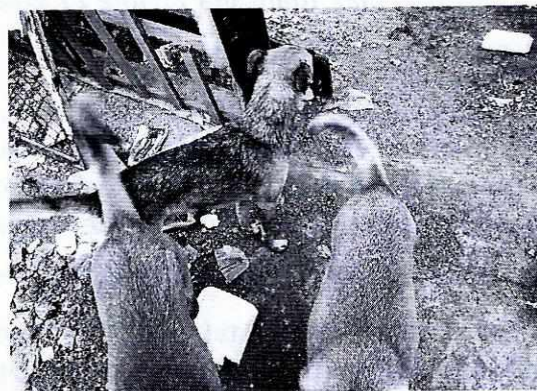
Imagen 2. Ejemplares caninos motivo de la denuncia.

En seguimiento a la denuncia, se realizó otra visita de reconocimiento de hechos, en la cual se observó que el domicilio denunciado cuenta con una malla metálica, como puerta provisional, en el mismo acto se observaron los ejemplares caninos antes descritos, observándose libres, con una condición corporal ideal, lo cual ha dicho del propietario son alimentos con comida casera y retazo de pollo, observándose recipientes de agua.