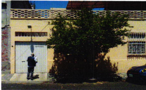
Figura 1. Lugar de los hechos denunciados.

artículo 15 BIS 4 fracción IV de la Ley Orgánica de esta Entidad, diligencia durante la cual una persona habitante del lugar donde se denunciaron los hechos objeto de la presente investigación, hizo de conocimiento al personal adscrito a esta Subprocuraduría que no contaba con animales de compañía. Cabe señalar que el personal de la PAOT, desde el espacio público, no constató la existencia de algún ejemplar canino con las características descritas en la denuncia, ladridos provenientes del interior de la vivienda u olores característicos de su presencia.