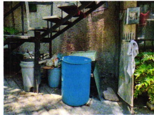
Figuras 1 y 2. Lugar de los hechos denunciados.

En seguimiento de lo anterior, personal de esta Subprocuraduría informó a la persona denunciante que durante visita de reconocimiento de hechos no se constató la presencia de los ejemplares caninos en el sitio señalado en su denuncia, por lo que los hechos que motivaron su denuncia dejaron de existir.