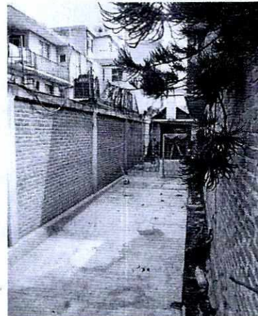
Fotografías 1 y 2. Vista del exterior e interior del inmueble referido en el escrito de denuncia.

En seguimiento a la denuncia, se realizó un tercer reconocimiento de hechos por personal adscrito a esta Procuraduría, durante el cual se constató lo siguiente: