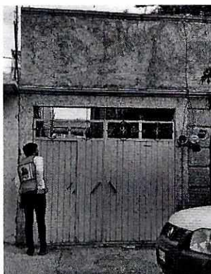
Fotografía 7. Vista del inmueble motivo de denuncia.

En seguimiento a la denuncia, se realizó un cuarto reconocimiento de hechos por personal adscrito a esta Procuraduría, durante el cual no se constató la existencia de algún ejemplar canino, ni ladridos provenientes del interior de la vivienda en comento u olores característicos de la presencia de dichos animales.