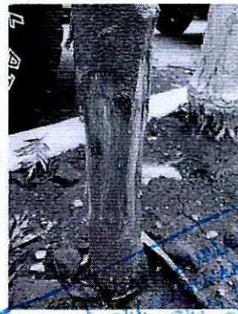
Fotografías 1, 2 y 3. Vista de la afectación que presentan los individuos arbóreos motivo de denuncia.