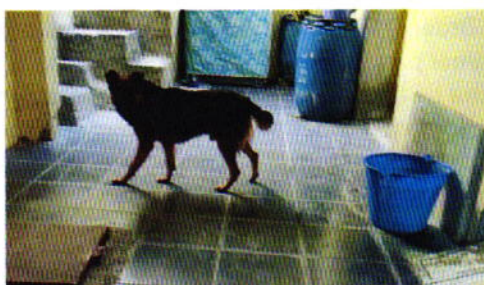
Figura 1. Ejemplar canino motivo de denuncia.

Es de resaltar que, en el Acuerdo de Admisión, que fue enviado por correo electrónico a la persona denunciante, se le hizo de conocimiento que contaba con un término de seis días hábiles para aportar las pruebas que estimara pertinentes en la investigación de los hechos, lo anterior conforme al artículo 90 del Reglamento de la Ley Orgánica de la Procuraduría Ambiental y del Ordenamiento Territorial de la Ciudad de México; sin embargo durante el procedimiento de investigación, no fueron proporcionados elementos de prueba que pudieran determinar incumplimiento a la normatividad en materia de bienestar animal.