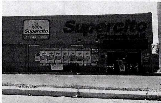
Fotografía 2. Vista del establecimiento mercantil con giro de minisúper denominado "Supercito Chedraui".

En virtud de lo anterior, y derivado del cumplimiento voluntario por parte del establecimiento mercantil con giro de minisúper denominado "Supercito Chedraui", se llevó a cabo el retiro de la bocina al exterior del inmueble, además de que la persona denunciante señaló que la problemática motivo de la denuncia dejó de presentarse, se da por concluida la investigación de conformidad con el artículo 27 fracción VII de la Ley Orgánica de la Procuraduría Ambiental y del Ordenamiento Territorial de la Ciudad de México.