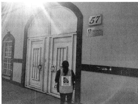
Fotografía 1. Fachada del inmueble señalado como el de los hechos denunciados

Por lo anterior, se realizaron diversas llamadas telefónicas al número señalado en el escrito de denuncia, sin embargo, no fue posible localizar a la persona denunciante; de igual manera, se envió un correo electrónico a la dirección que autorizada para oír y recibir notificaciones, en el cual se le solicitó a la persona denunciante que señalara algún otro número telefónico y horario en el cual pudiera ser contactada, lo anterior a efecto de que proporcionara información que permitiera continuar con la investigación, sin embargo, dicho correo no fue atendido.