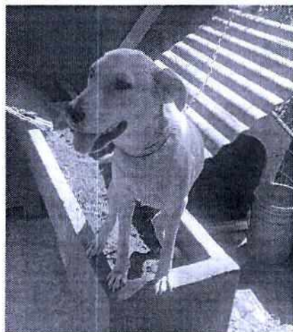
Fotografía 1. Ejemplar canino observado

En este sentido, de las constancias que obran en el expediente en el que se actúa, se desprende que personal de esta Subprocuraduría realizó el reconocimiento de hechos correspondiente, constatando la existencia de un ejemplar canino (hembra de raza mestiza), con las siguientes características: