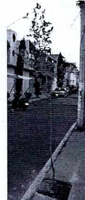
Fotografía 1. Vista de los individuos arbóreos de las especies comúnmente conocidas como Trueno y Tuja.

En virtud de lo antes expuesto, esta Entidad considera procedente emitir la presente resolución, de conformidad con el artículo 27 fracción VI de la Ley Orgánica de esta Procuraduría, por imposibilidad legal, al no constatar irregularidades en materia de afectación de arbolado.