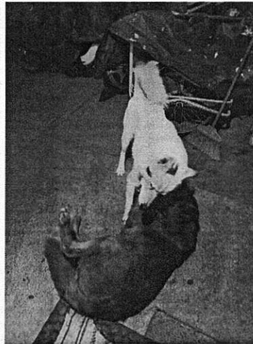
Fotografía 2. Vista de los caninos sueltos al interior del inmueble.

Con base en lo antes citado, esta Entidad considera que una vez que se dio atención a la presente denuncia por parte del personal adscrito a esta Subprocuraduría, se está en aptitud de emitir la resolución administrativa que conforme a derecho proceda, esto de acuerdo con la fracción VII del artículo 27 de la Ley Orgánica de la Procuraduría Ambiental y del Ordenamiento Territorial de la Ciudad de México, por el cumplimiento voluntario de las disposiciones jurídicas en materia de bienestar animal.